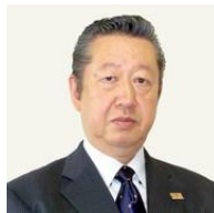
メイン・インストラクター ITコーディネータ/防災士