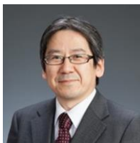
サブ・インストラクター ITコーディネータ/防災士