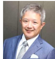
サブ・インストラクター ITコーディネータ/防災士